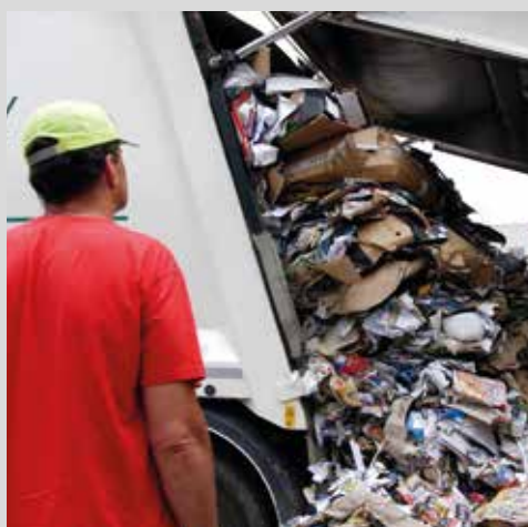
Svozový vůz vysypávající papír