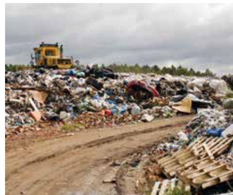
Skládka v Březince