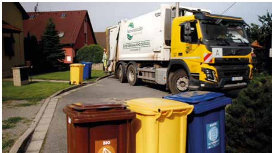
Svozový vůz na Malé Hané